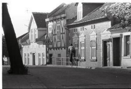
Beata Szady Wieczny początek Warmia i Mazury