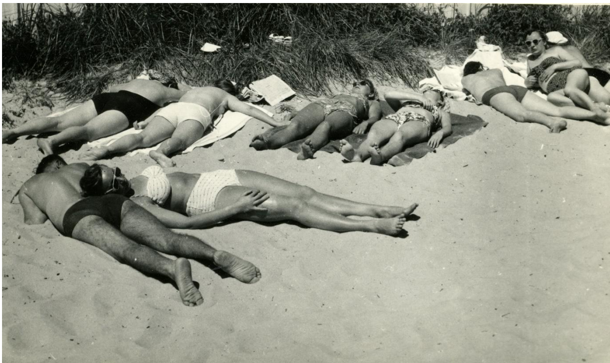
Fot. Plażowicze, fot. Kazimierz Komorowski, lata 50. XX w. (zbiory Muzeum Miasta Gdyni)

Bilety na wydarzenia dostępne są na stronie www.bilety.muzeumgdynia.pl